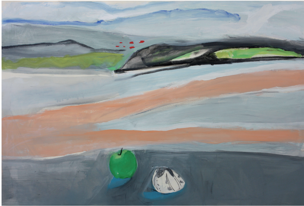
Arenales sobre gris Mixta/papel 76 × 112 cm. Año 2017