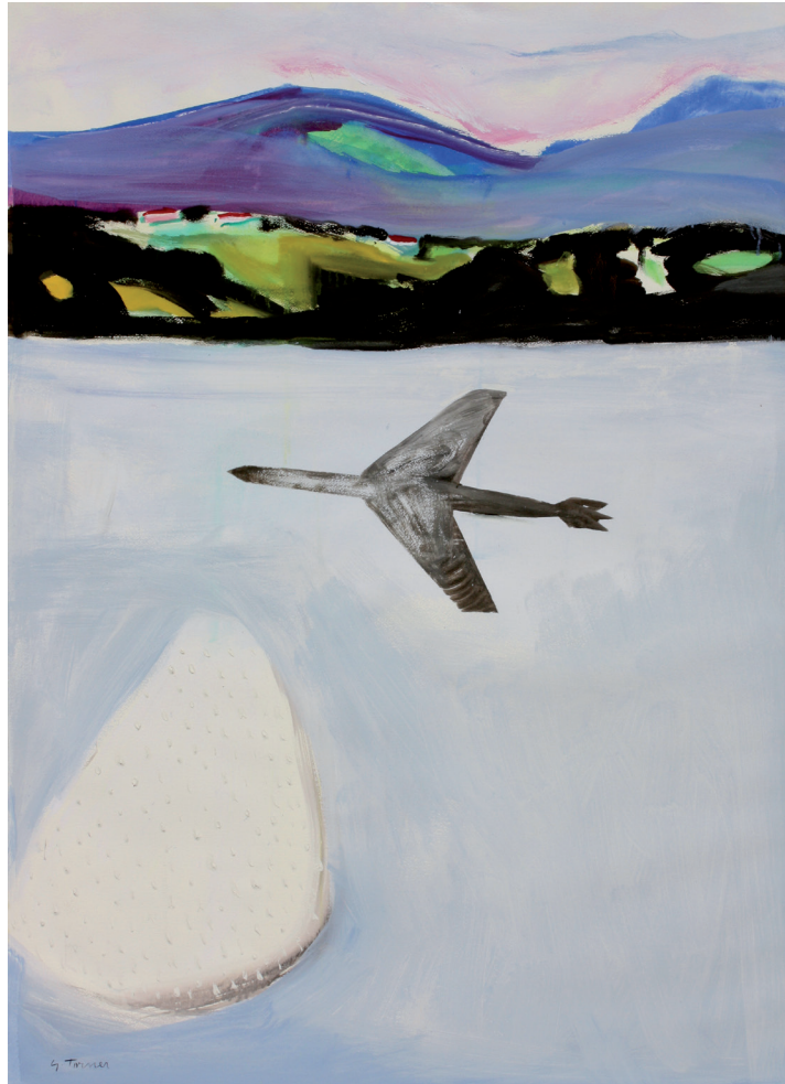
El viaje Mixta/papel. 140 × 100 cm. Año 2010