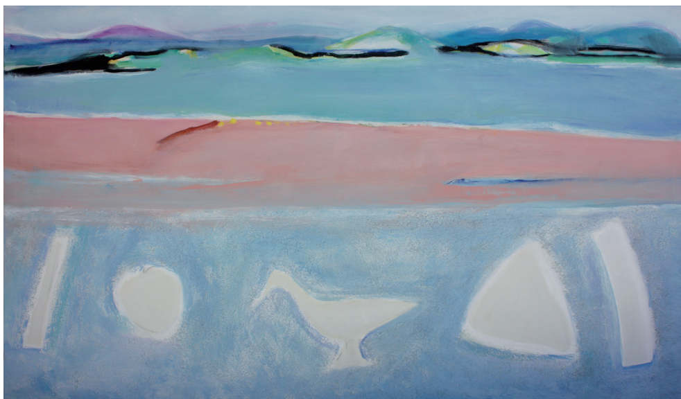
Siluetas para Matisse Óleo/lienzo. 114 × 195 cm. Año 2009