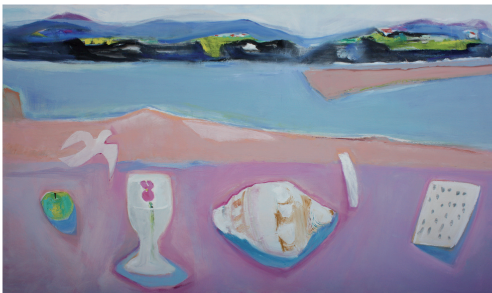
El puntal habitado Óleo/lienzo. 114 × 195 cm. Año 2009