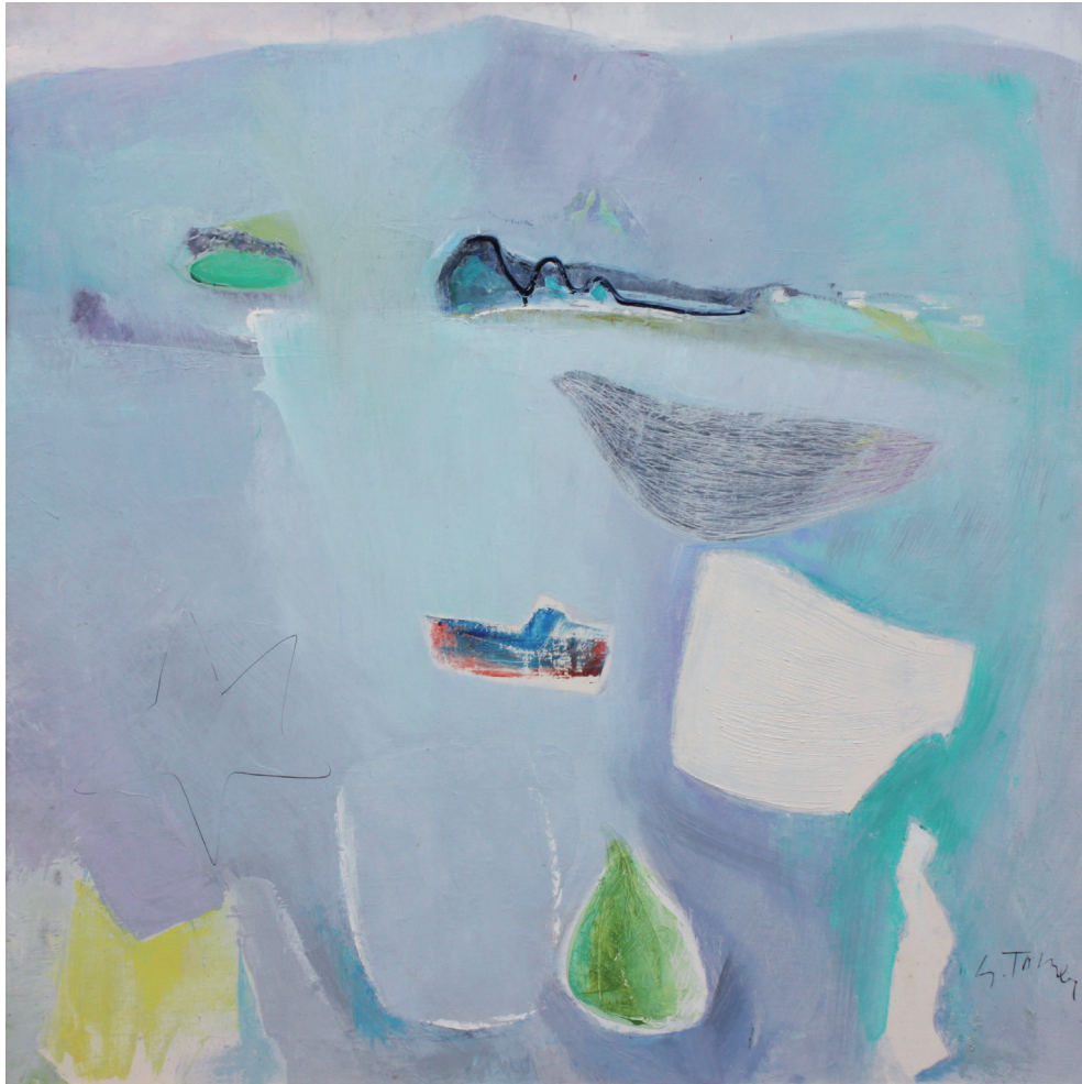
Bahía del pájaro (París) Óleo/lienzo 100 × 100 cm. Año 1996