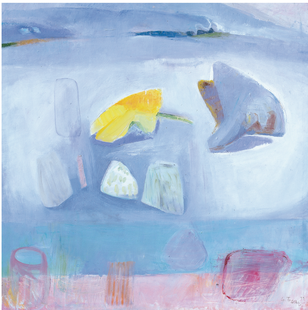
Espacio gris y amarillo Óleo/lienzo. 150 × 150 cm. Año 1999