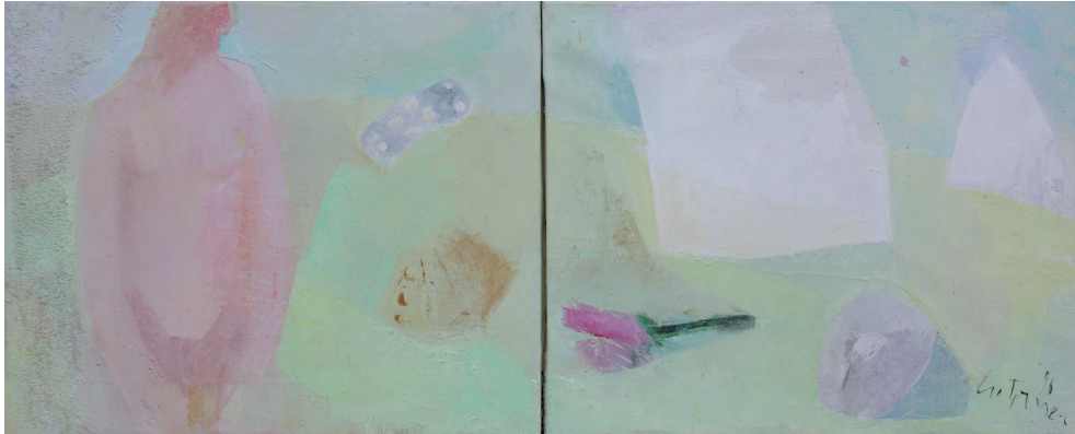
Díptico amarillo Óleo/lienzo. 33 × 82,5 cm. Año 1996