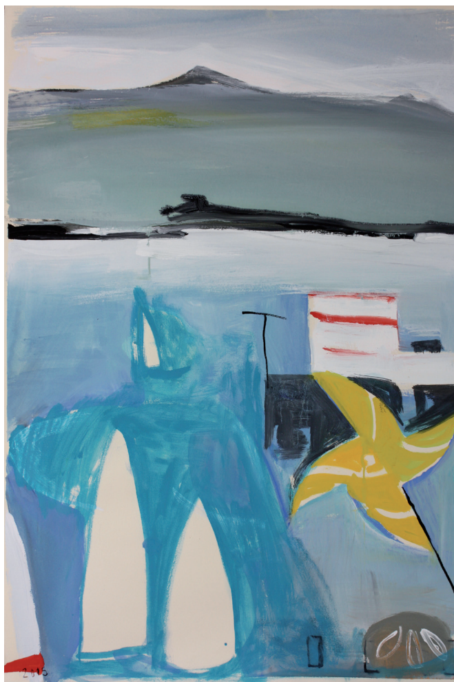
Regata y molinillo surrealista Mixta/papel. 112 × 76 cm. Año 2015