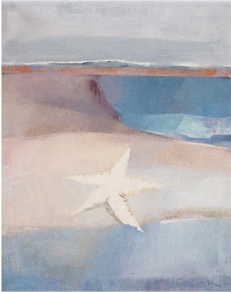
Estrella Óleo/lienzo. 92 x 73 cm. Año 1982