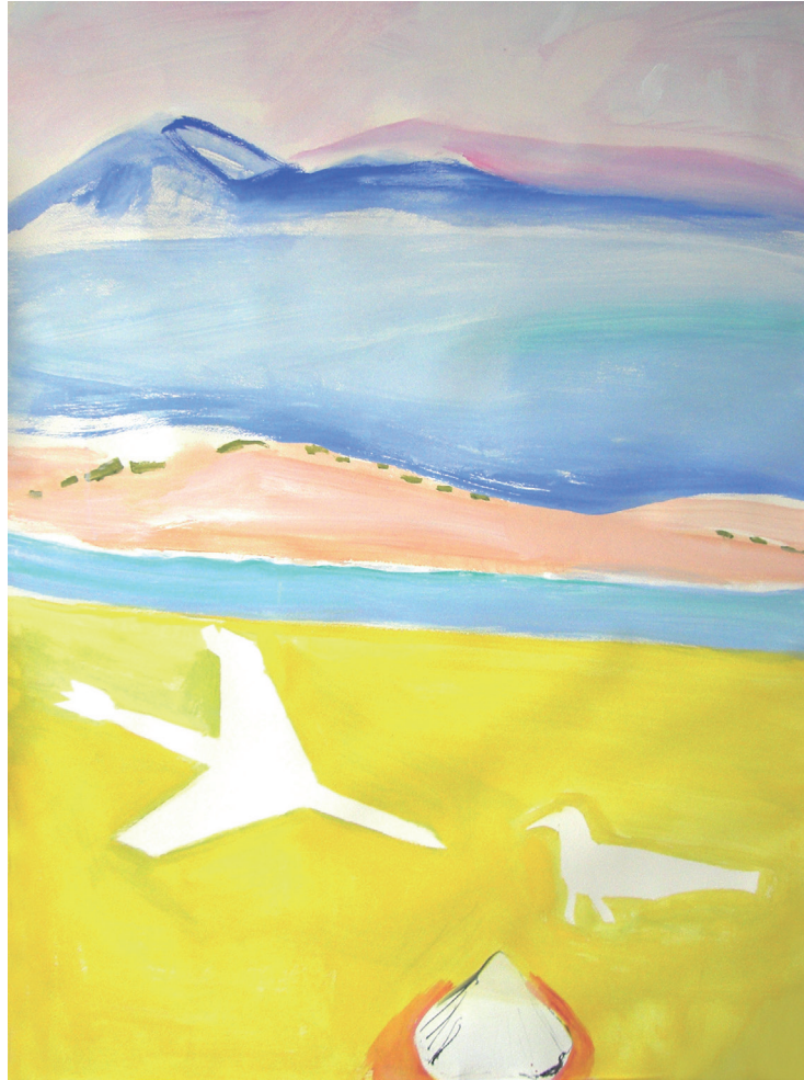
Bahía amarilla Mixta/papel. 140 × 100 cm. Año 2010