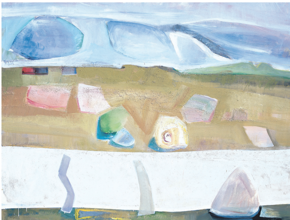
Composición horizontal Oleo mixta/lienzo 150 × 200 cm. Año 1996