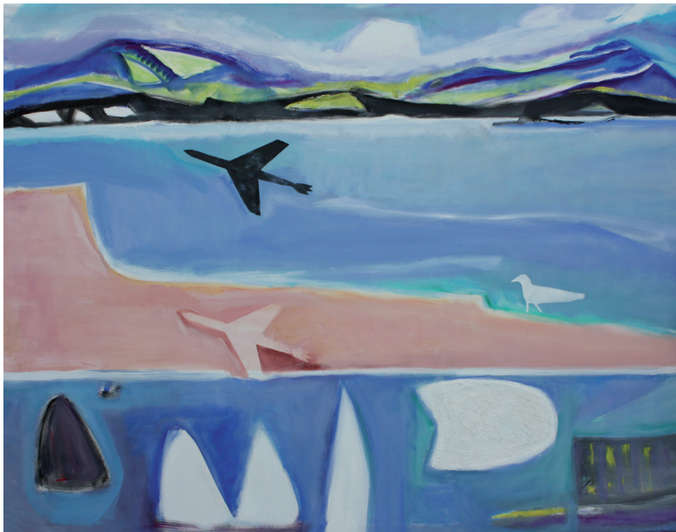
Bahía, pájaro, avión Óleo/mixta/lienzo. 200 × 250 cm. Año 2010