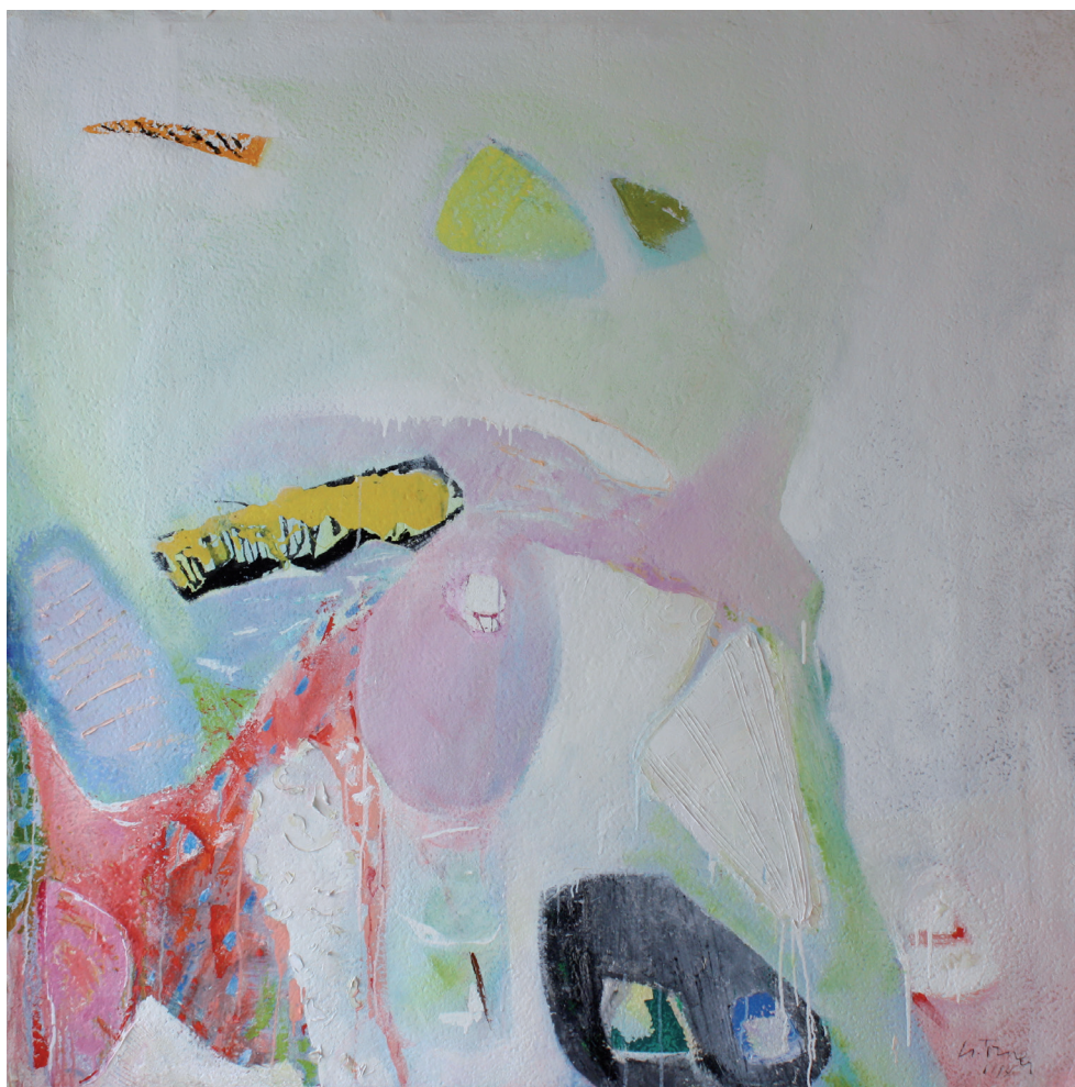
Bahía de los poetas Mixta/papel artesanal. 150x 150 cm. Año 1994