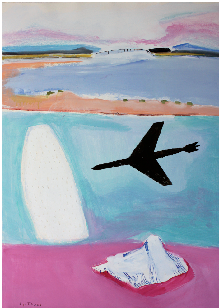
Avión y Caracola Mixta/papel. 140 × 100 cm. Año 2010