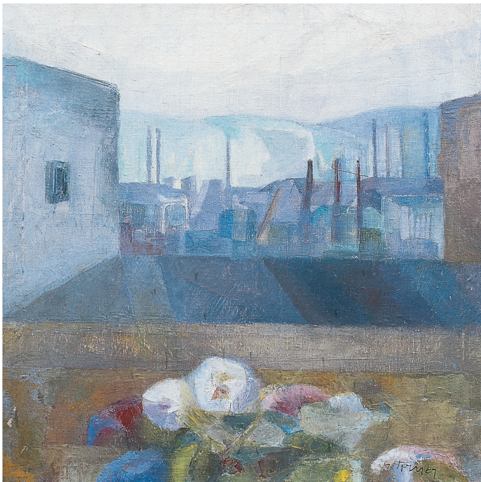
Chimeneas Óleo/lienzo. 65 × 65 cm. Año 1970