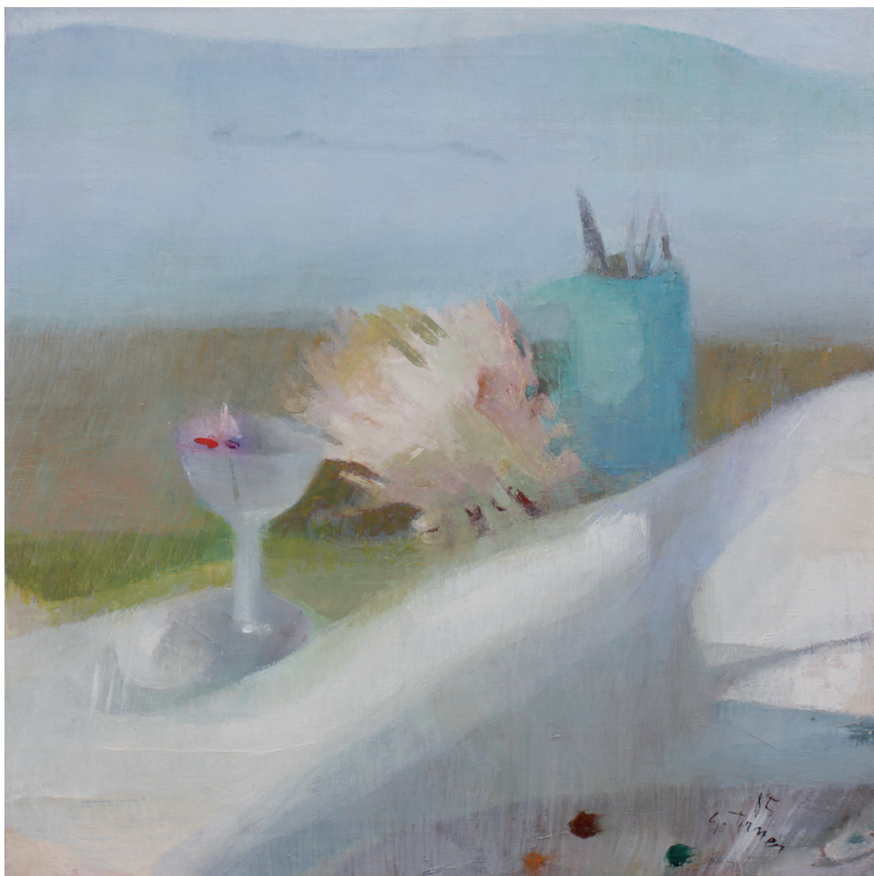
Bodegón del coral Óleo/lienzo. 65 × 65 cm. Año 1985