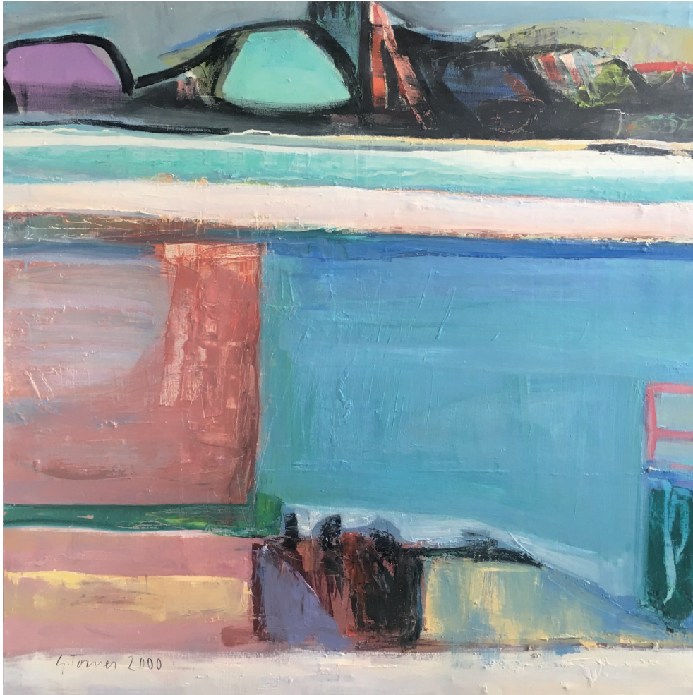
Bahía Óleo/lienzo. 100 × 100 cm. Año 2000