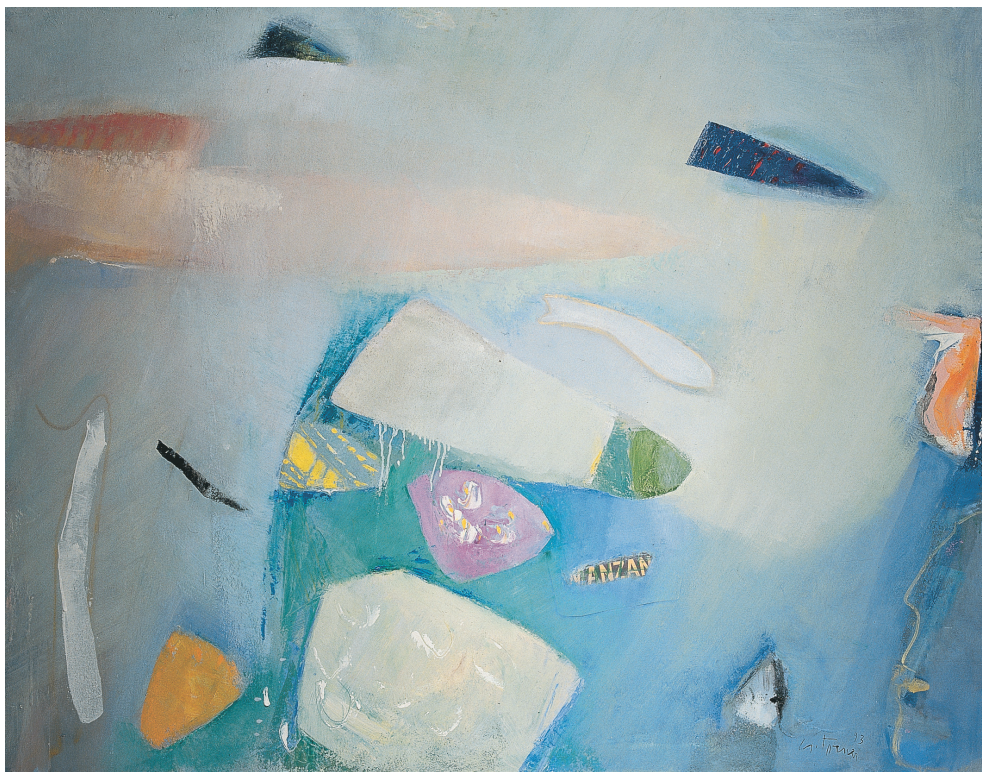
Fondos marinos Mixta/lienzo. 114 x146 cm. Año 1993