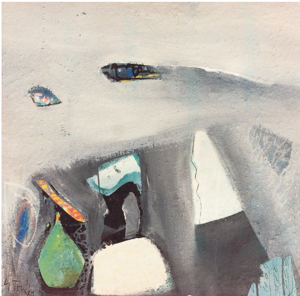
Bodegón y vela blanca Mixta/tintas/papel artesanal. 70 × 70 cm. Año 1994