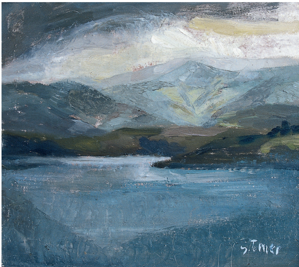
Turbonada Óleo/tabla. 35 × 39 cm. Año 1960