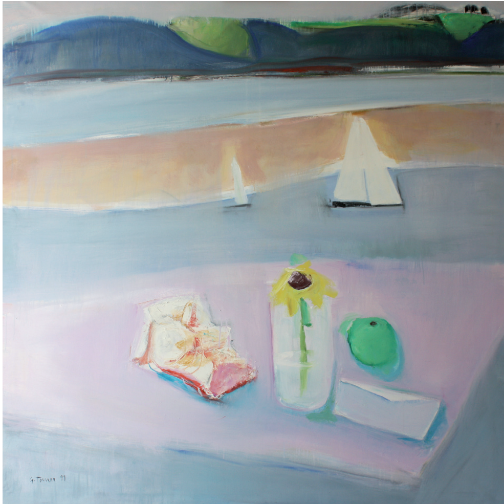
Bahía con regata Óleo/lienzo. 150 x 150 cm. Año 1999