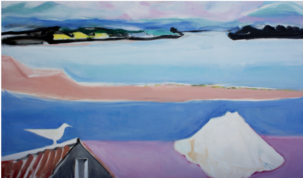
Diálogo con la caracola Óleo/lienzo. 114 × 195 cm. Año 2009