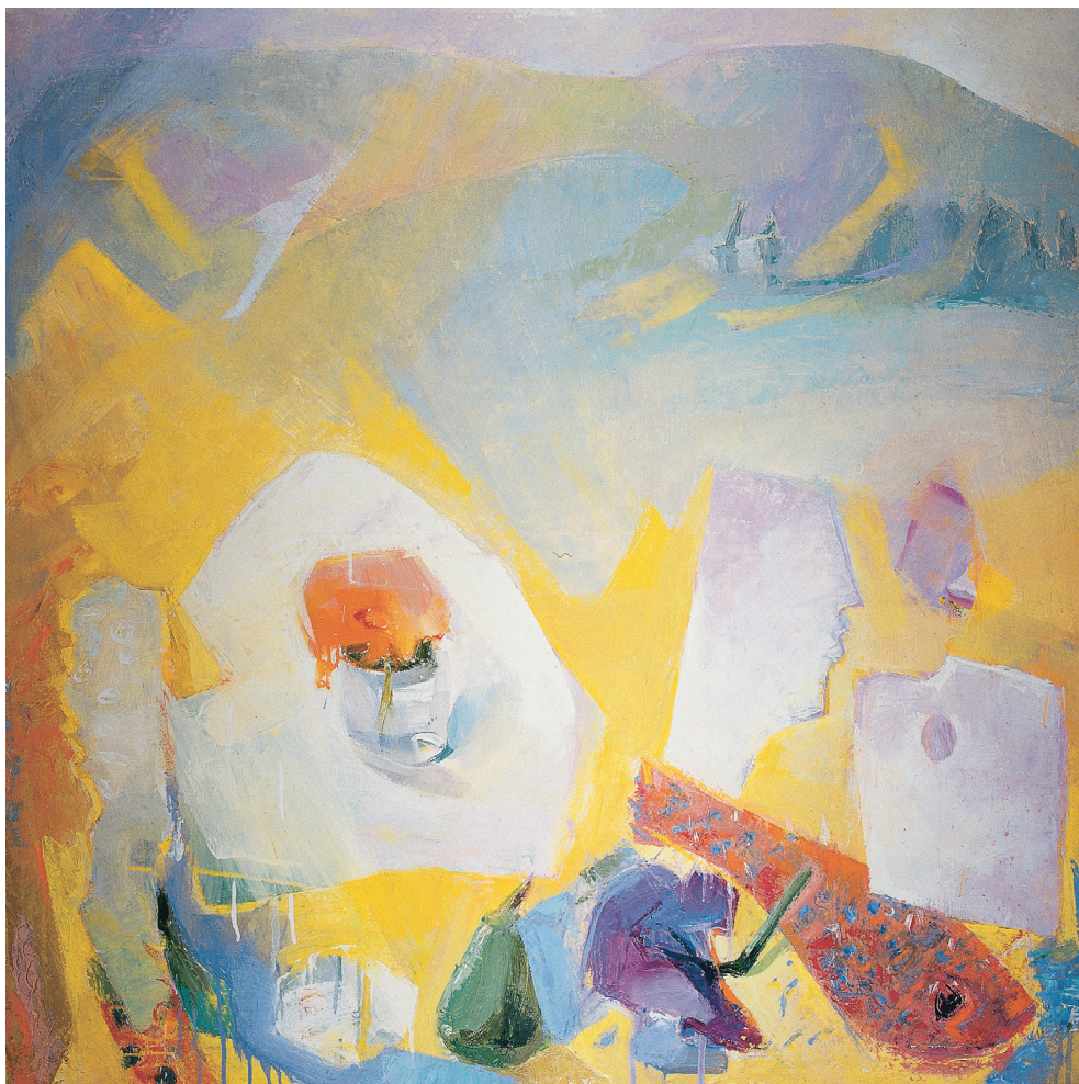
Bodegón amarillo y siluetas Óleo/lienzo. 116 × 116 cm. Año 1992