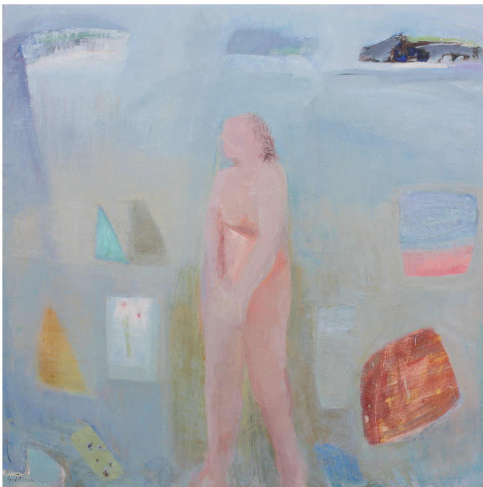
Espacio con figura Óleo/lienzo. 150 × 150 cm. Año 1999