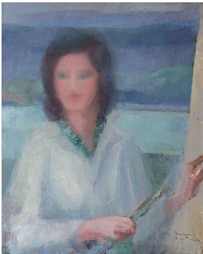
Autorretrato Óleo/lienzo 81 × 65,5 cm. Año 1970