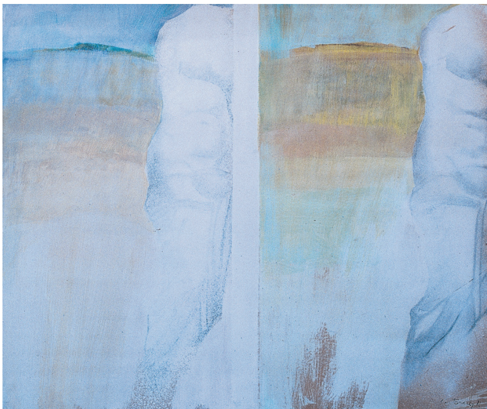
Venus de la concha Mixta/papel/tabla. 102 x 122 cm. Año 1982