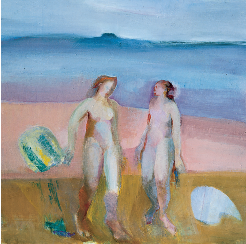
Bañistas y cometa Óleo/lienzo. 122 × 122 cm. Año 1987