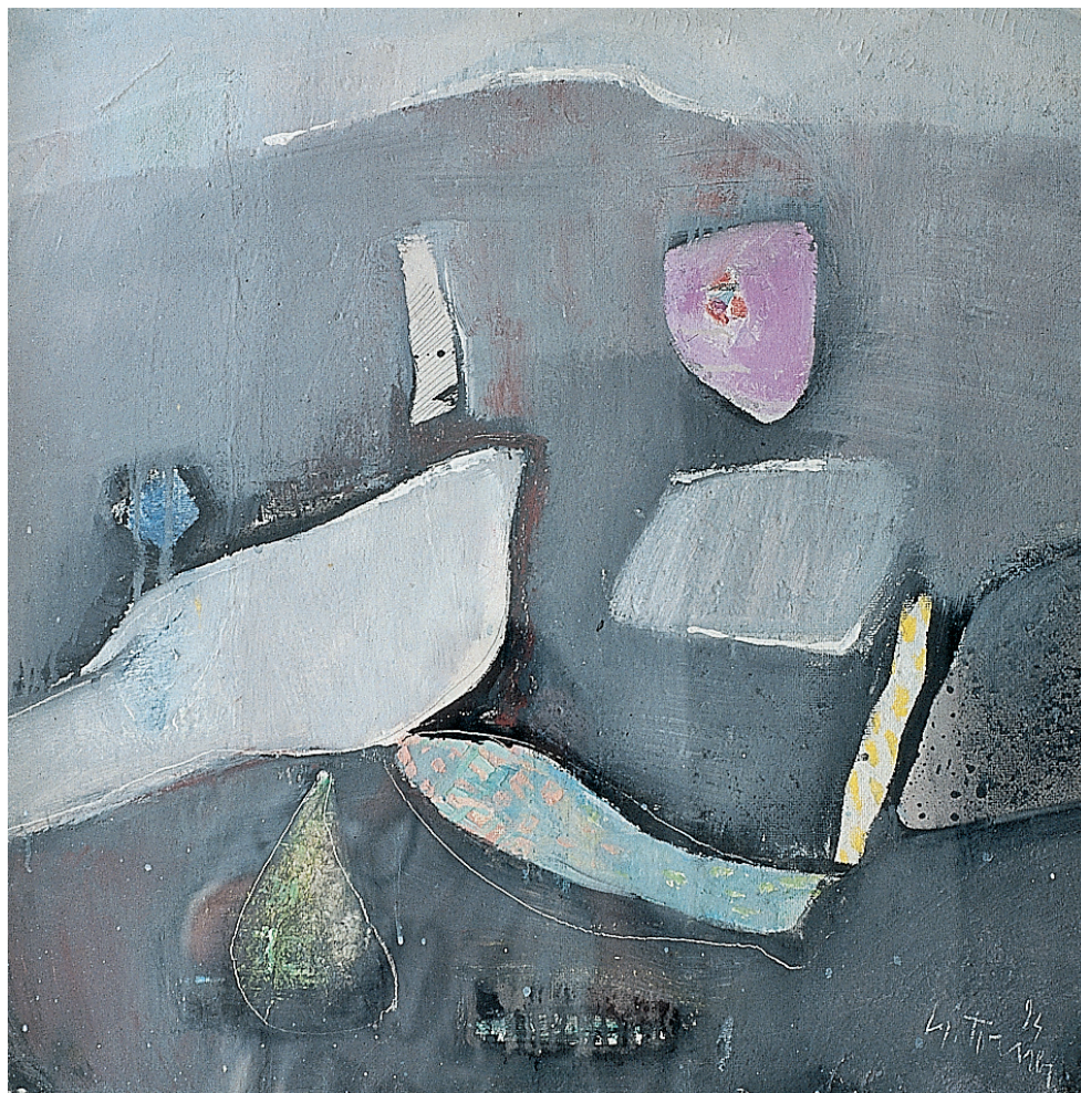
Paloma y negros Mixta/tintas/papel artesanal. 70 × 70 cm. Año 1994