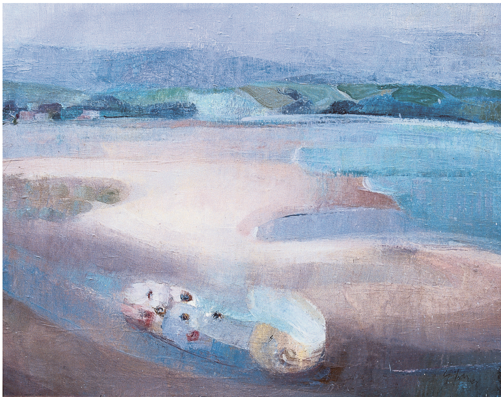
Floración en el puntal Óleo/lienzo. 81 × 100 cm. Año 1979