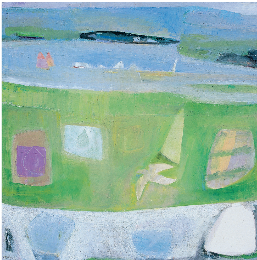
Espacio verde Óleo/lienzo. 150 x 150 cm. Año 1999