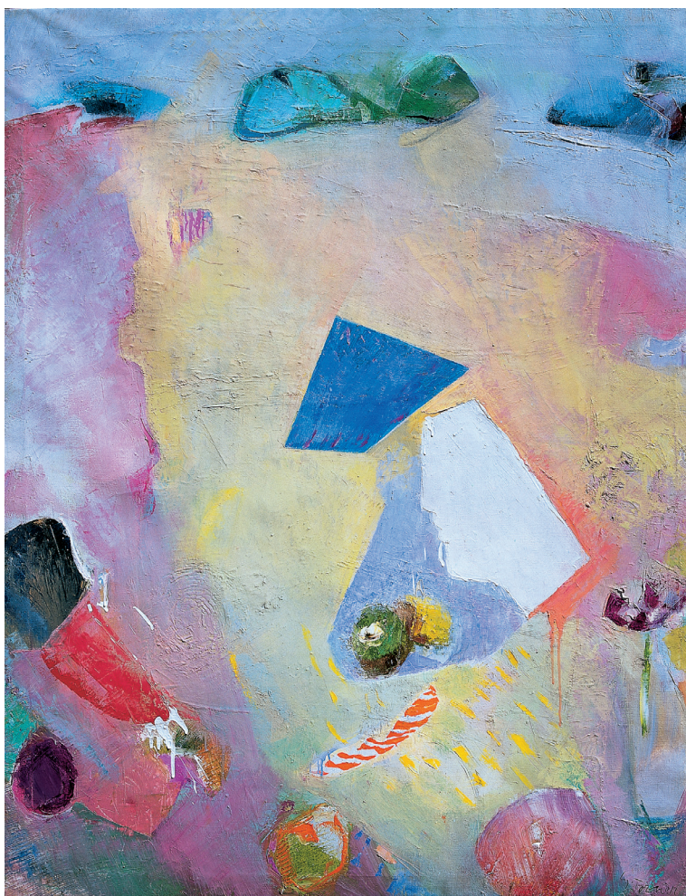
Bodegón cometa azul Óleo/lienzo. 146 × 114 cm. Año 1994