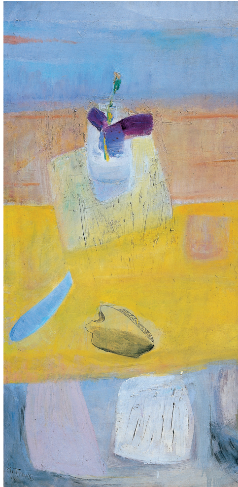
Espacio Iris morado Óleo/mixta/lienzo. 150 × 75 cm. Año 1998