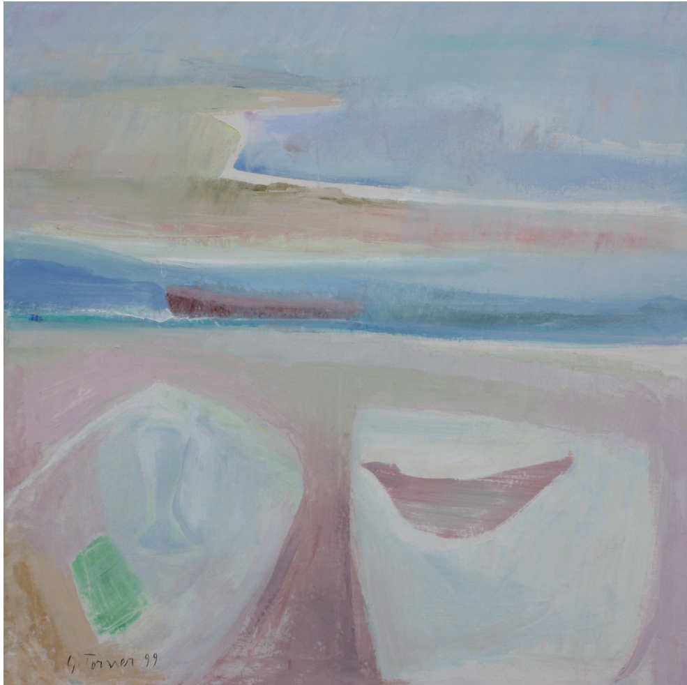
Puntal habitado Óleo/lienzo. 100 × 100 cm. Año 1999